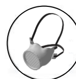
Masque technique Prix unitaire 28 € TTC + filtres de rechange