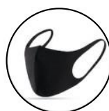
Masque lavable 50 fois Prix unitaire 5 € TTC