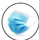
Masque chirurgical Prix unitaire : 0.60 € TTC